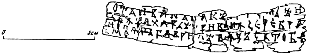
Прорись грамоты № 667

отъ[и]ван[ък]акъ[орте]мьѣи === ѡежзахарьѣ [г]ривьнжсеребра === иопѡ[тъ]гавр[ил]ѣ азъ съ тобо === ме