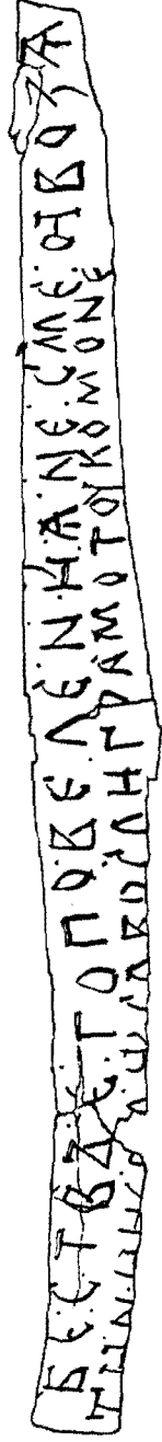
Прорись грамоты № 650