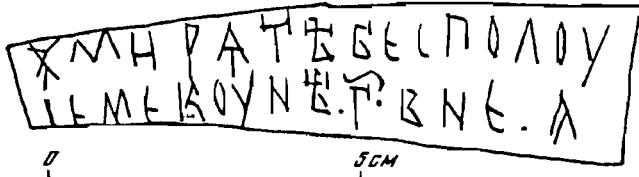
Прорись грамоты № 631