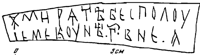
Прорись грамоты № 631