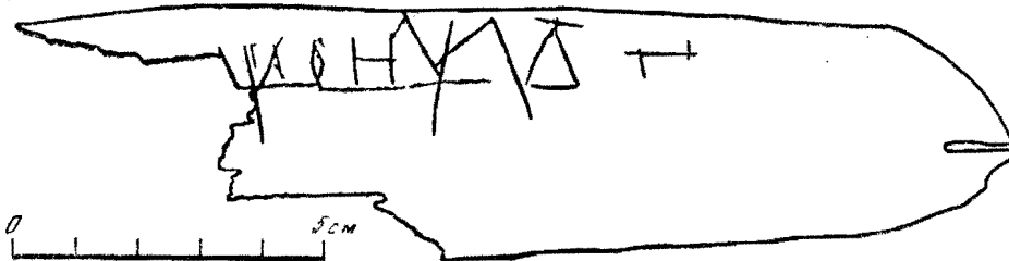
Прорись грамоты № 593