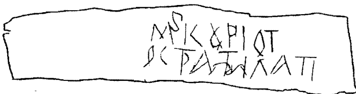
Прорись грамоты № 552