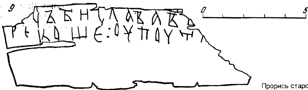
Прорись старорусской грамоты № 9