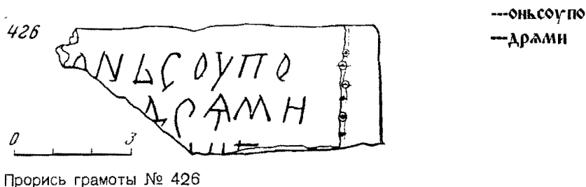
Прорись грамоты № 426

Грамота № 426 найдена на Ильинском раскопе, в квадрате 140, на глубине 5,16 м. Это небольшой обрывок верхней части документа: