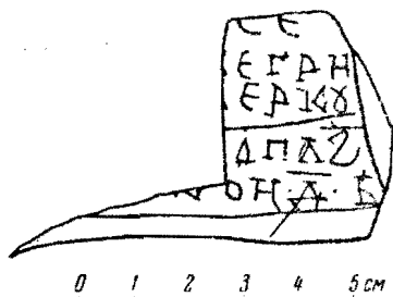
Прорись грамоты № 216