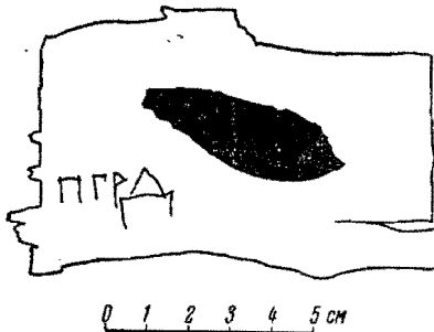
Прорись грамоты № 209