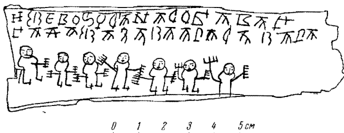
Прорись грамоты № 206, внешняя сторона коры

Спор идет о двух буквах, которые стоят на месте сотен и на месте десятков. Первая буква «ч». Оно бокаловидное, обычное (у Онфима оно всегда такое). Пси здесь нет, поэтому Б. А. Рыбаков предположил, что средний стержень пси (только наличие этого стержня отличает букву от «ч») исчез под трещиной. Но трещина эта ясно видна на изданной макрофотографии (СА, 1959, № 4). Она тонка и зигзагообразна, гораздо тоньше, чем линии Онфима. Если на этом месте находилась