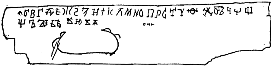
Прорись грамоты № 205

Третья буква недописана; это, по-видимому, неудавшаяся фи́та. Внизу незаконченный рисунок.