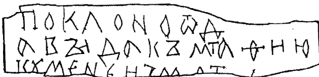
Прорись грамоты № 146