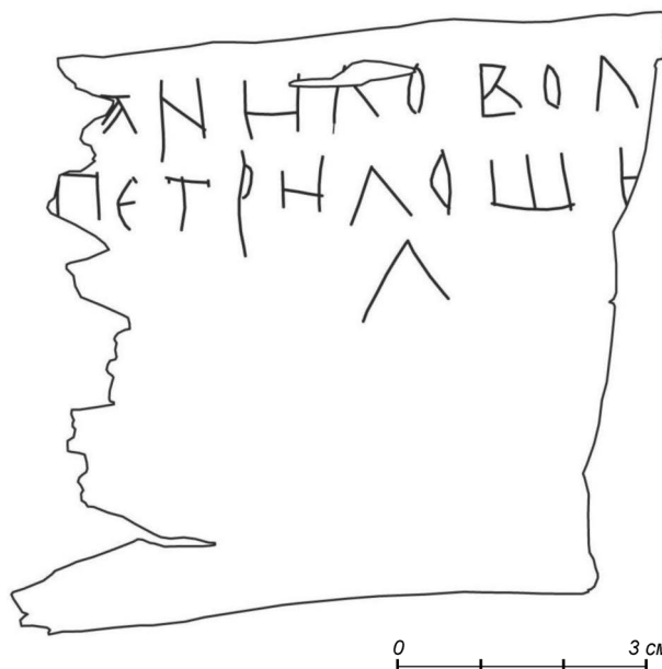
Прорисъ грамоты № 1056

Роль буквы л посреди 3-й строки из-за отсутствия правого края грамоты неясна. Можно было бы даже предположить, что это просто л из слова шил , вынесенное для орнаментального эффекта (три буквы Л стро-