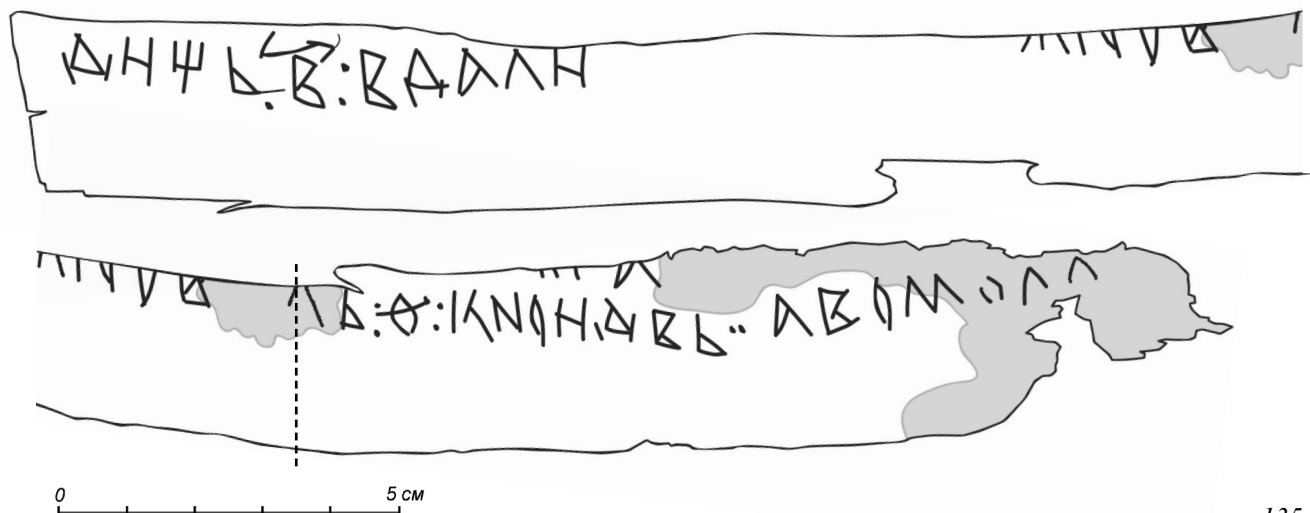
Прорись грамоты № 1039