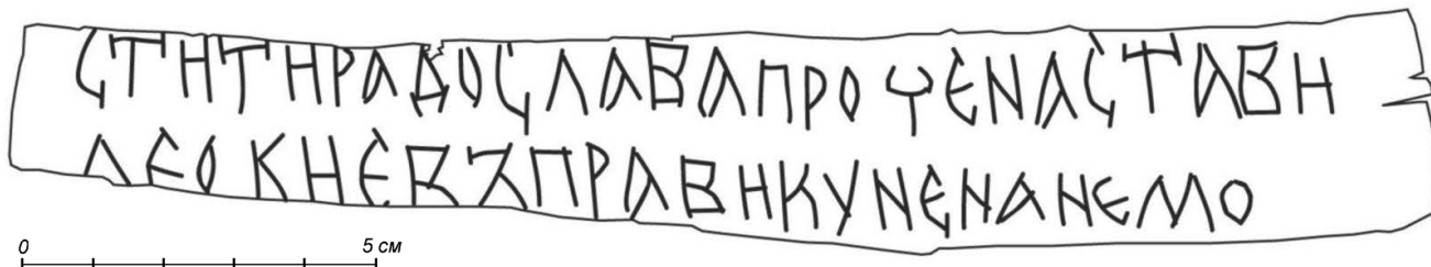
Прорись грамоты № 1016

СТИТИРАДОСЛАВАПРОЧЕНАСТАВИ ЛЕОКИЕВЪПРАВКУНЕНАЕМО