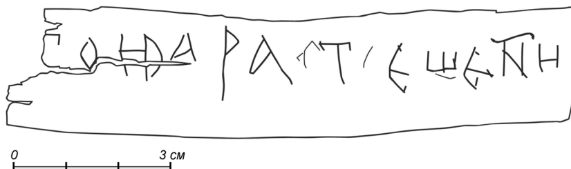
Прорись грамоты № 993