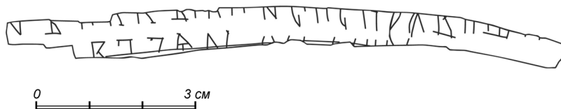
Прорись грамоты № 984