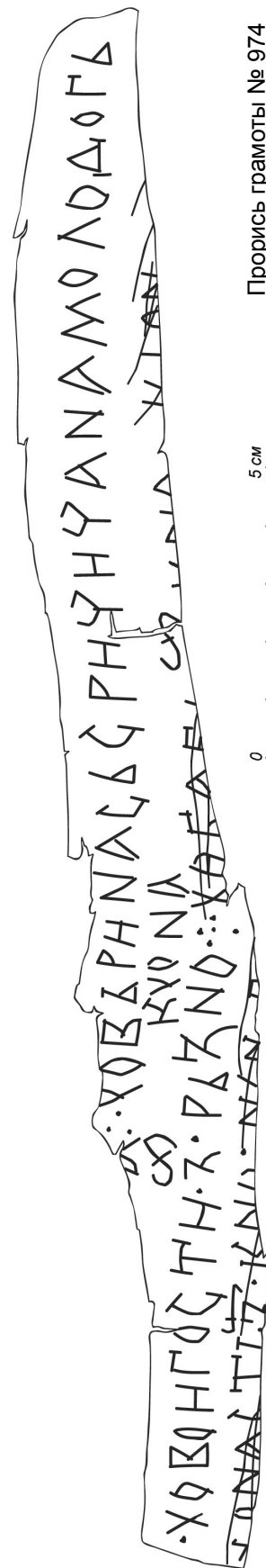
Прорись грамоты № 974

Молодогъ — 'солод'; слово известно из берестяных грамот № 689, 847 и 863 (см. ДНД 2 : 287).