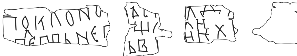
Прорись грамоты № 971

Вычлняются только два слова: поклоно и племенем(о) .