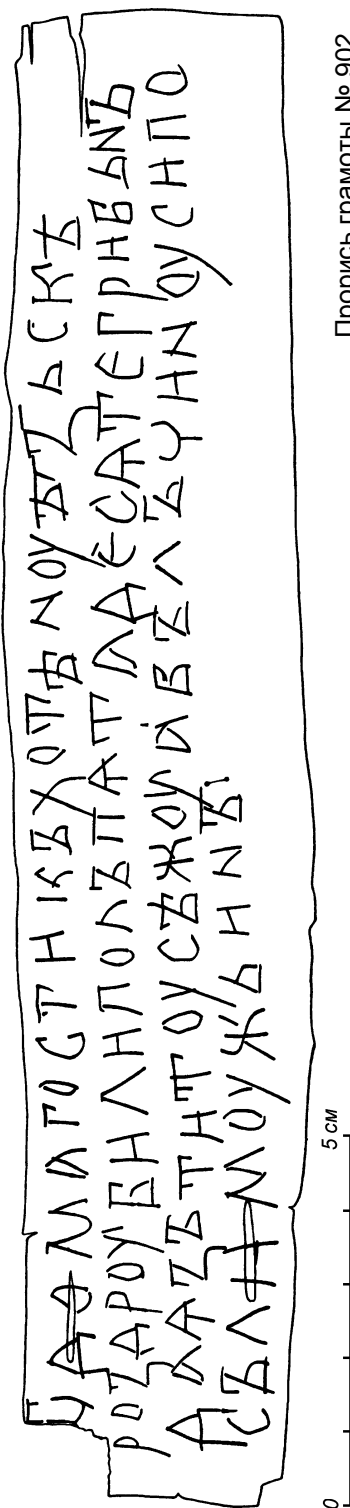
Прорись грамоты № 902

Представляет значительный интерес буква ѣ (полый юс большой), встретившаяся в этом тексте дважды (к сожалению, правда, самый низ буквы в обоих случаях оторван, что несколько уменьшает надежность этих при- меров). Ранее эта буква была отмечена только в существенно более поздних берестяных грамотах — в азбуке № 778 (нач. XIII в.) и в фрагменте № 151 (2 четв. XIII в.).