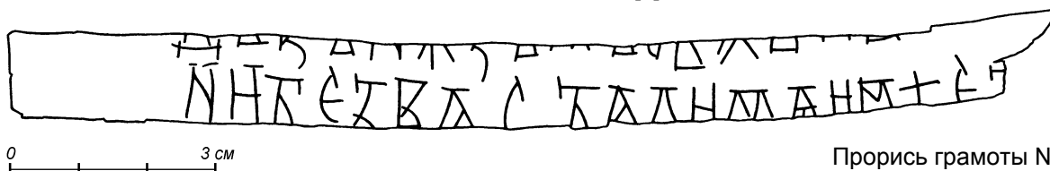
Прорись грамоты № 886