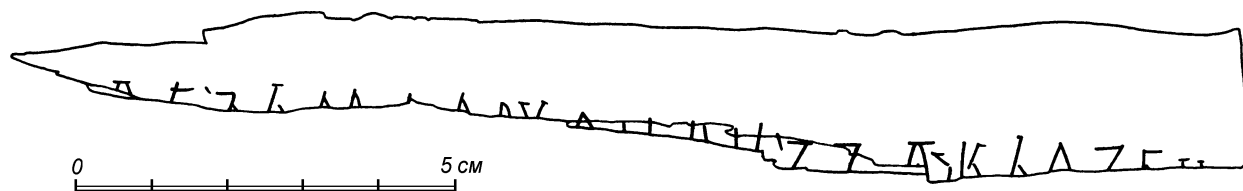
Прорись грамоты № 876

В начале сохранившегося текста перед [ъз] стояло л или д , после [ъз] — ь или е .