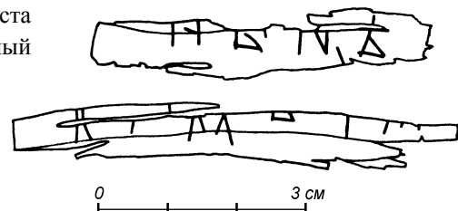
Прорись грамоты № 873