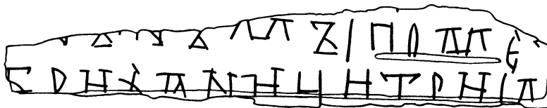
Прорись грамоты № 871