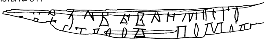
Прорись грамоты № 841

Длина 11,4 см, ширина 1,2 см. Стратиграфическая дата: середина XII в.