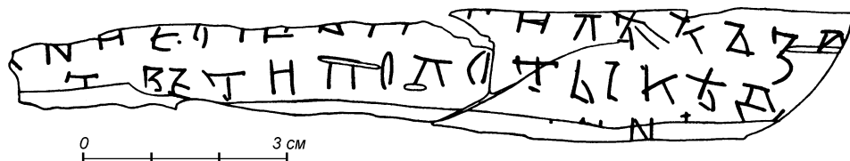
Прорись грамоты № 803