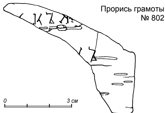
Прорись грамоты № 802