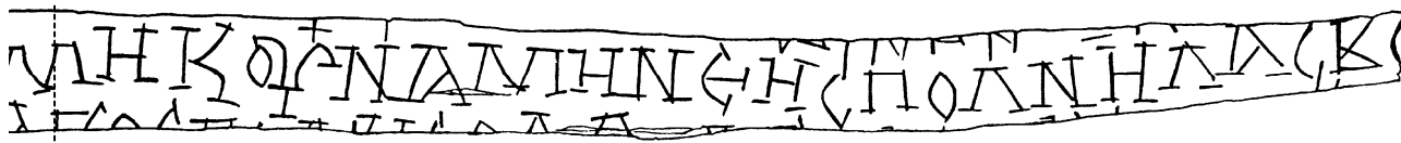
Прорись грамоты № 711