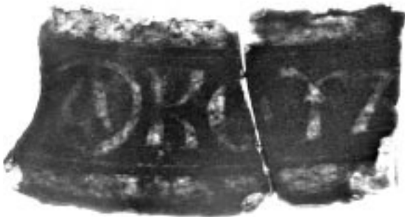
Рис. 3. Надпись на фрагментах витражного стекла (руины Борисоглебского собора, 2004 г.)

При раскопках того же храма (в 2004 г.) была сделана поистине уникальная находка: это два небольших фрагмента стекла (совпадающих при соединении), на которых видны остатки букв, написанных золотом по темному (черно-зеленому) фону (рис. 3). Значение первой буквы несомненно – это А в круге, что означает сокращение греческого слова «агиос». Следовательно, далее должно быть написано имя святого. Первая буква – К или В , далее О , чтение остальных двух проблематично: третий знак – либо «ижица», либо «пси» в виде цветка лилии, последний знак напоминает Ъ . Но сочетание предыдущих двух – О и Ψ(?) – вызывает сомнение в прочтении последнего сохранившегося знака как Ъ , так как он не может следовать за гласной. Вероятнее, что это остатки буквы З («земля»), а называемой « Ъ -образной», а тонкая золотая линия по нижнему краю строки – декоративная, прочерченная под более широкой золотой полосой, что отчетливо прослеживается по