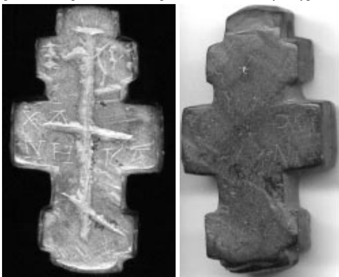
Рис 6. Каменный наперсный крест (раскоп № 25, 1995 г.)

Несмотря на фрагментарность, условность прочтения и датировки, следует отметить, что находка берестяной грамоты в Старой Рязани, где культурный