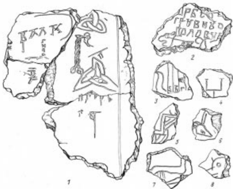
Рис. 4. Надписи-граффити на обломках штукатурки Борисоглебского собора (из раскопок А.Л. Монгайта и В.П. Даркевича)

Надпись-граффити с именем Игоря еще раз подтверждает предположение о строительстве храма Глебом Ростиславичем и летописные сообщения о захоро-