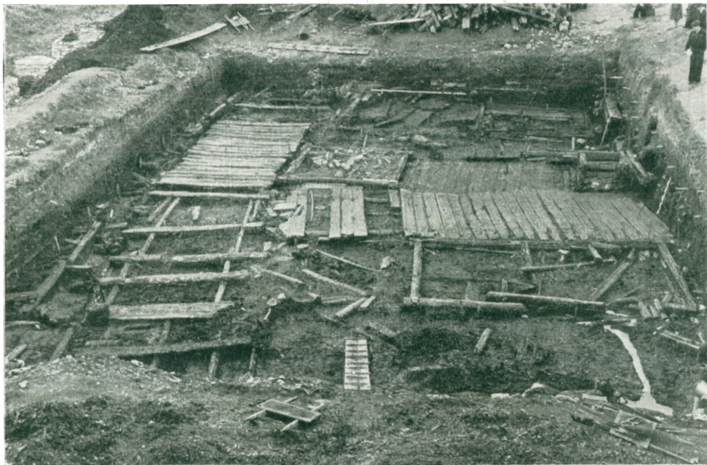
Общий вид деревянной мостовой улицы и проулка с прилегающими к ним основаниями построек XII в. на участке раскопок 1958 г.

На раскопе возле здания почты на Советской улице общей площадью около 700 кв. м удалось проследить на протяжении 50 м направление одной из древнейших улиц, существовавшей с XI в., неоднократно застилавшейся деревянными тесаными плахами или бревнами. К главной улице примыкали проулки с такими же поперечными настилами или же пешеходные мостки, прокладывавшиеся между домами и соединявшие их с главной улицей. Культурный слой здесь достигал 5 м толщины.