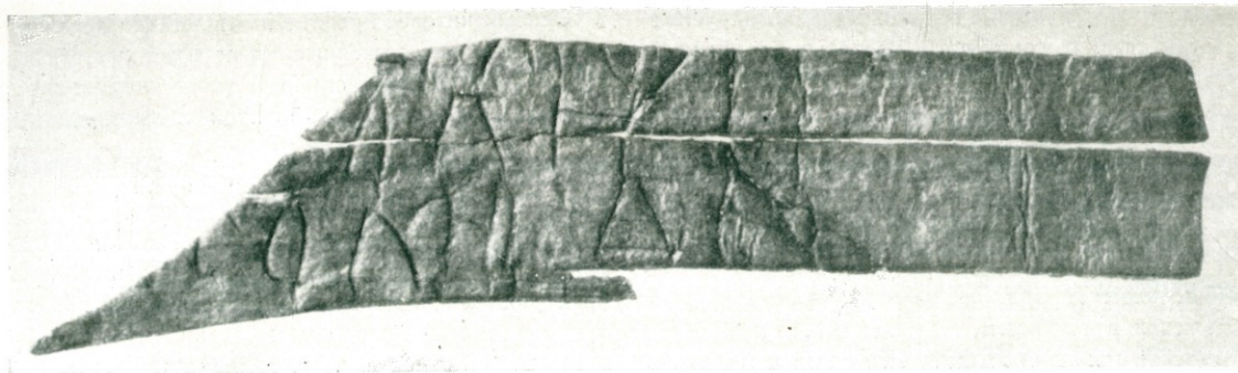
Обрывок берестяной грамоты, найденной в раскопе у здания почты в Пскове.

Среди многих находок заслуживает особого внимания обрывок первой для Пскова берестяной грамоты, найденной в 1958 г. Буквы грамоты очень трудны для чтения. Но тем не менее, находка эта имеет большое значение для изучения истории культуры русского города.